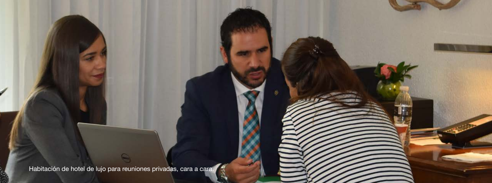
Habitación de hotel de lujo para reuniones privadas, cara a cara.